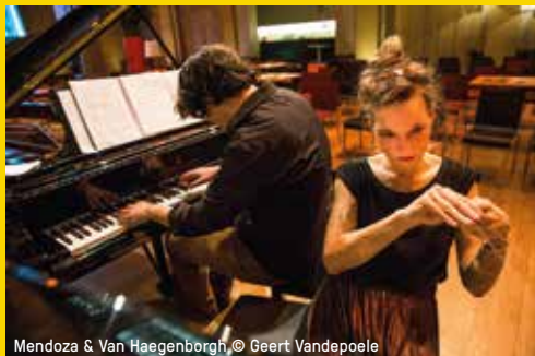
Mendoza & Van Haegenborgh

Tickets Gent presenteert en commercialiseert de voorstellingen die Noords Erfonds vzw produceert en uitnodigt in het kader van een erkende werking binnen het kunstendecreet.