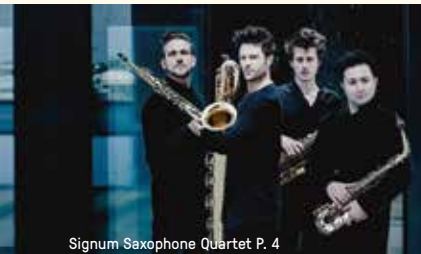
Signum Saxophone Quartet P. 4

DO 30.04.20 KRAAKPAND MET O.A. ZEE SKIRTS 4 bands, 4 genres