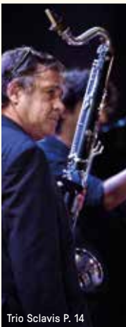
Trio Sclavis P. 14