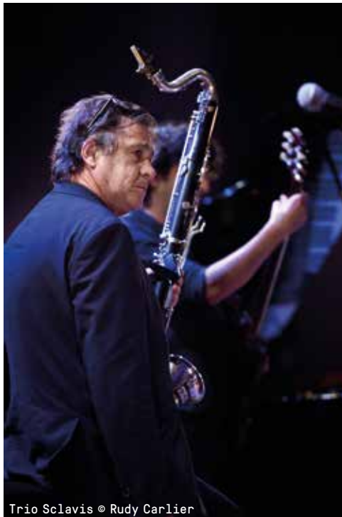
Trio Sclavis

DO 23.04.20, 20U15 € 22 BASIS / € 18 (-26/65+) / € 7 STUDENT