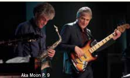
Aka Moon P. 9