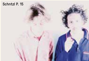
Schntzl P. 15