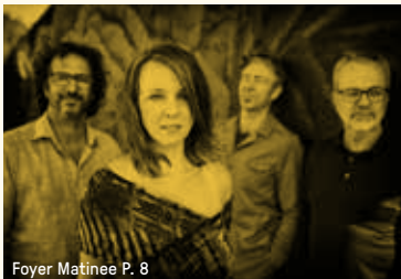
Foyer Matinee P. 8