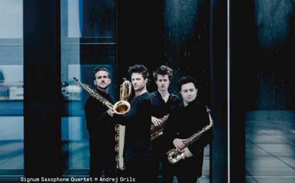
Signum Saxophone Quartet