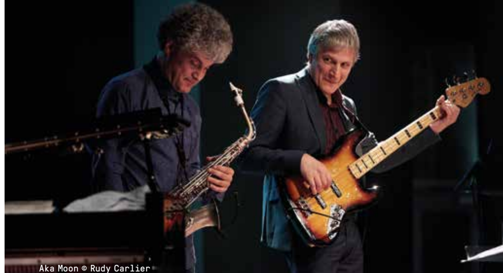
Aka Moon

DO 02.04.20, 20U15 € 24 BASIS / € 20 (-26/65+) / € 7 STUDENT