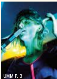
UMM P. 3