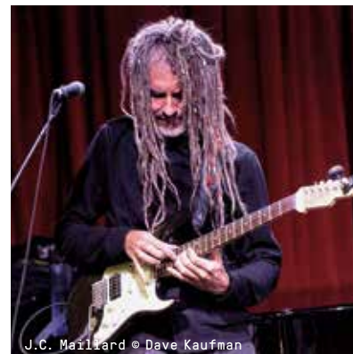
J.C. Maillard

Line-up dag 2 Donder / Jean-Paul Estiévenart Trio feat. Fabian Fiorini / Otlla / Julien Tassin trio