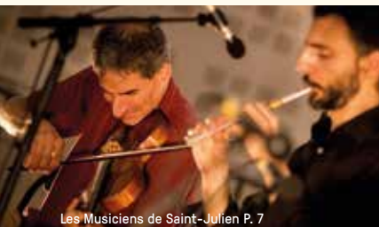
Les Musiciens de Saint-Julien P. 7