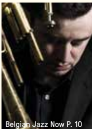
Belgian Jazz Now P. 10