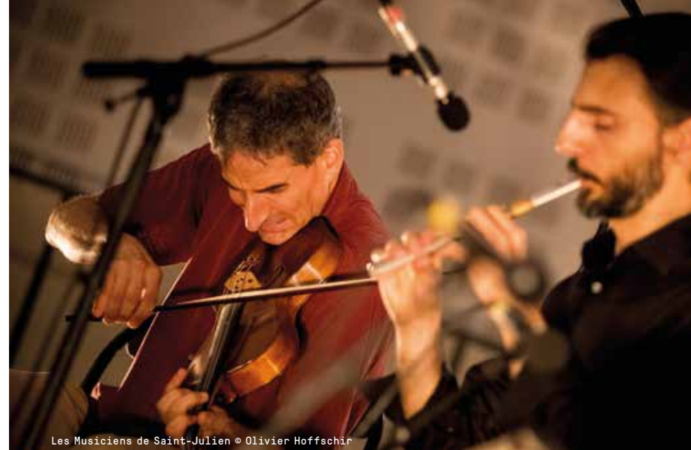
Les Musiciens de Saint-Julien