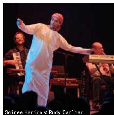
Soirée Harira

De Britse singer-songwriter Charlie Cunningham combineert zijn intieme fluisterstem met Zuiders percussief gitaarspel. Voor de liefhebbers van Nick Mulvey, Jose Gonzalez, Ben Howard en Bon Iver. De Noorse zangeres Siv Jakobsen debuteert met The Nordic Mellow .