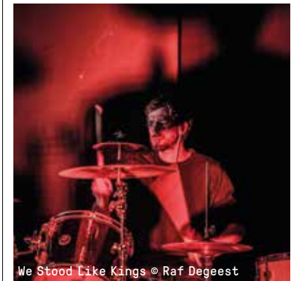
We Stood Like Kings

Een intieme concertavond met afgewisseld vier bands: Oko Yono, met herwerkte songs van de vrouwen rond Serge Gainsbourg, het Belgisch-Syrische duo Damast, de bizarre elektro-jazz van Bombathazz en de psychedelische pop van Spill Gold.