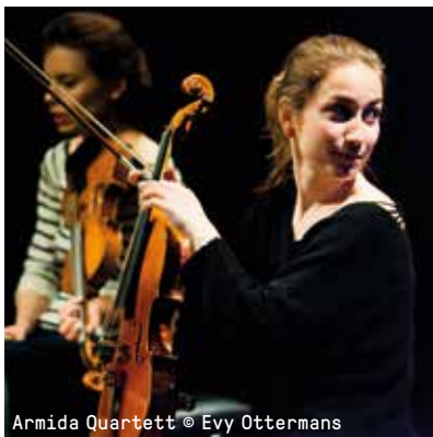
Armida Quartett

VR 01.12, 20U15 €23 / €19 (-26/65+) / €7 (STUDENT)