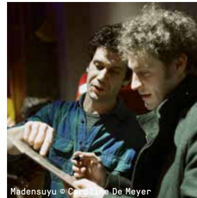
Madensuyu