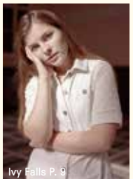
Ivy Falls P. 9