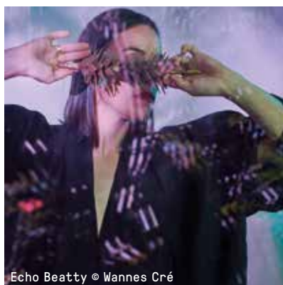
Echo Beatty

WO 18.12.19, 20U15 / €14.25 VVK / €16 ADK