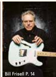
Bill Frisell P. 14