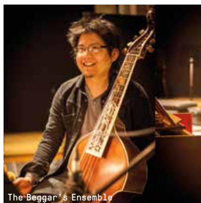
The Beggar's Ensemble