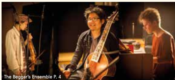
The Beggar's Ensemble P. 4