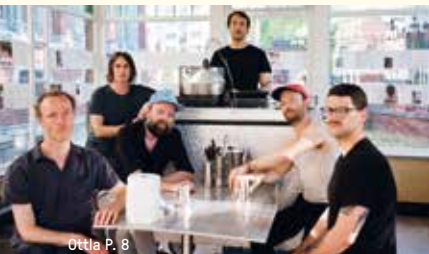
Ottla P. 8