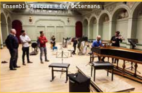
Ensemble Masques