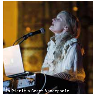
An Pierlé © Geert Vandepoele

Al meer dan twintig jaar valt het Duitse Fauré Quartett op door groot meesterschap en niet-aflatend speelplezier. Voor de zoveelste keer te gast boren ze nu minder bekend repertoire aan. Voor wie tot nu toe onbewogen bleef bij klassieke muziek telt hun concert als ultieme test.