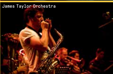
James Taylor Orchestra