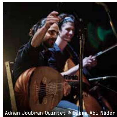
Adnan Joubran Quintet

ZA 07.10, 20U15 €21 / €17 (-26/65+) / €7 (STUDENT)